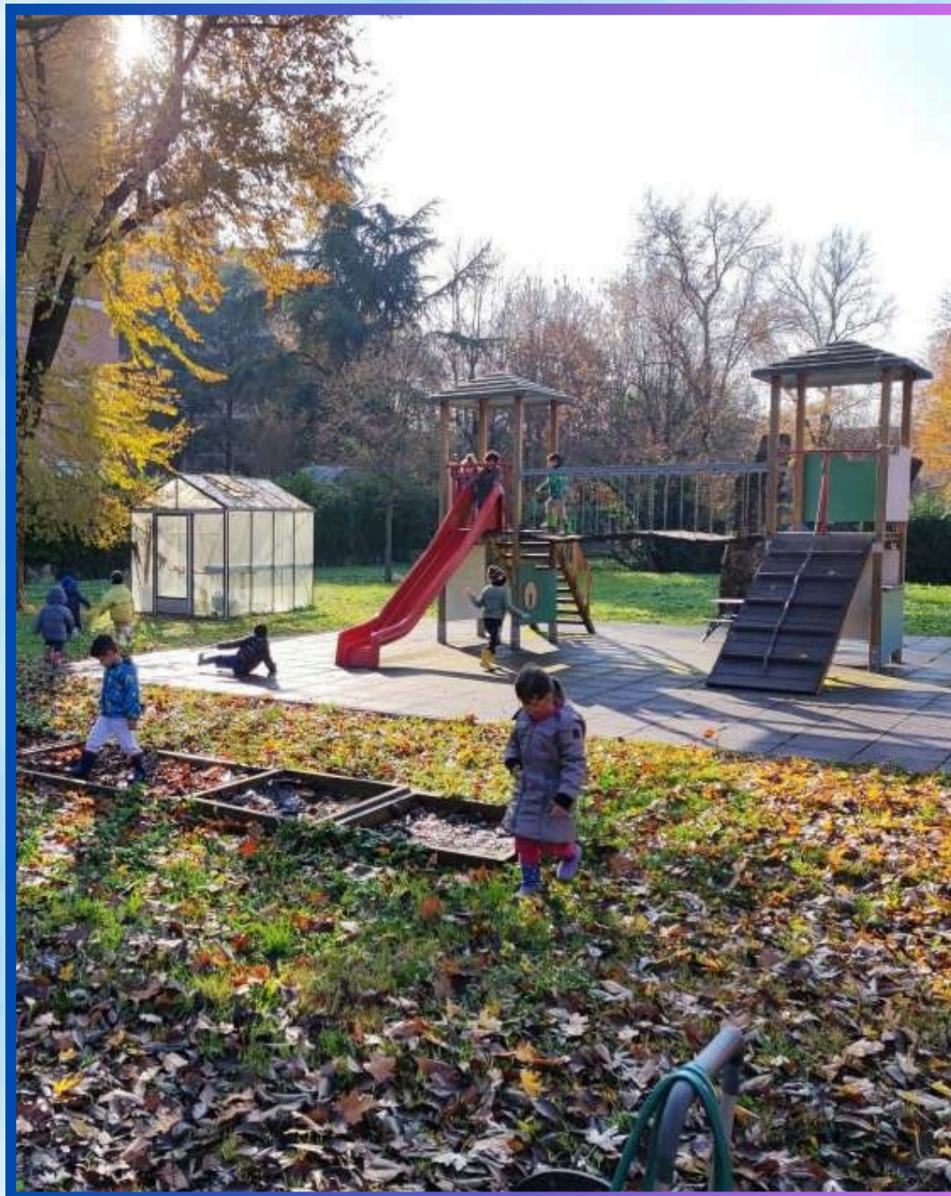
il giardino esterno