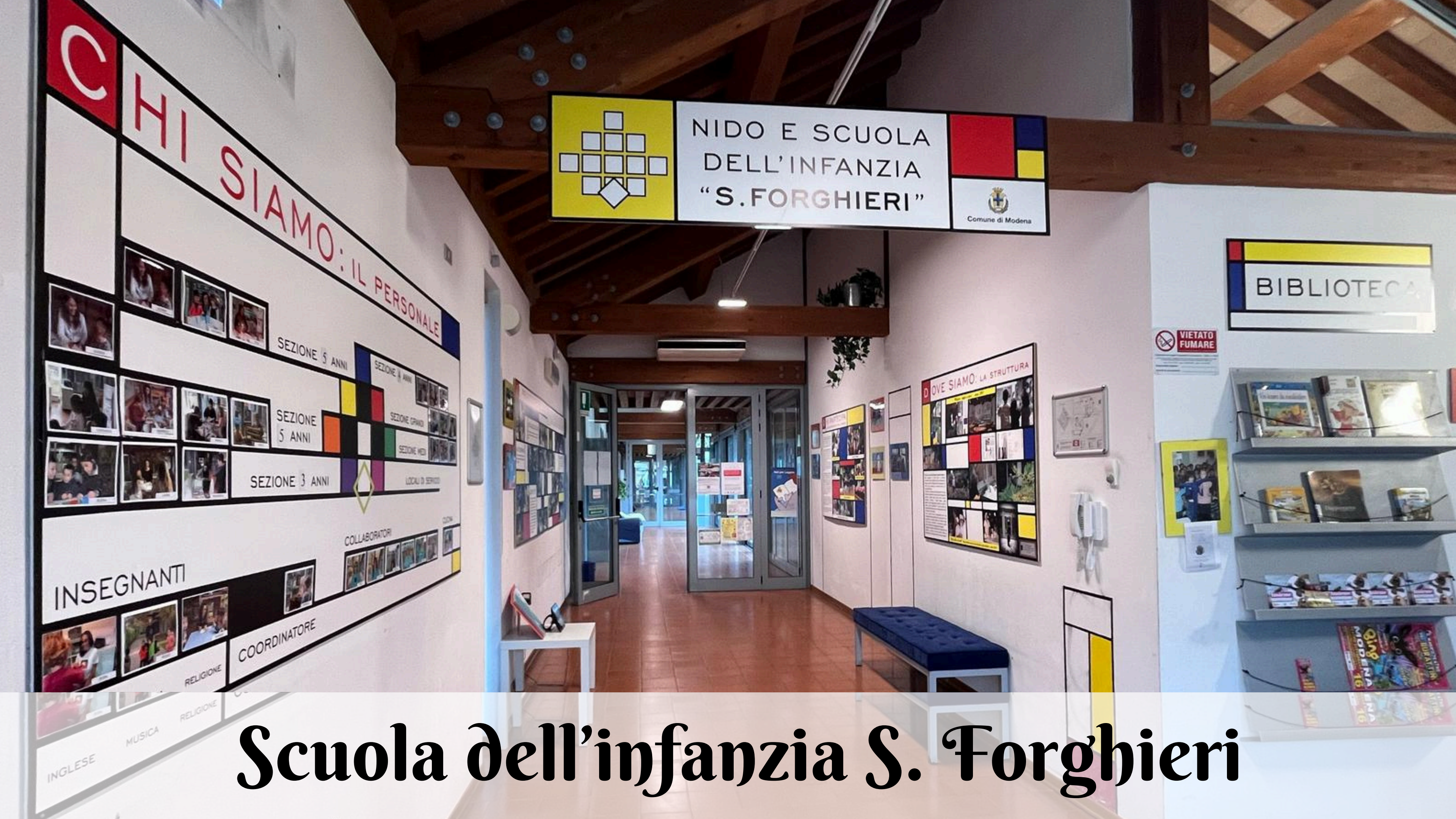
Scuola dell'infanzia S. Forghieri